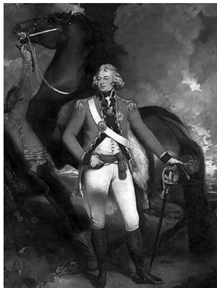
Герцог Йоркский, портрет работы Дж. Хоппнера