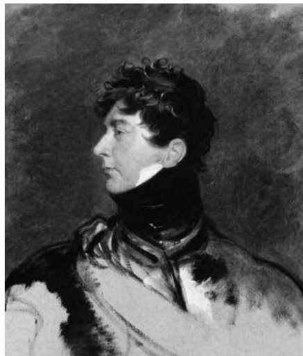
Принц Уэльский, портрет работы Томаса Лоуренса