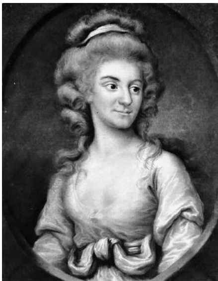
Герцогиня Йоркская, портрет работы Дж. Хоппнера

◇ 24 ноября [1791 года] я был приглашен принцем Уэльским в Оутландс 11 к его брату герцогу Йоркскому 12 . Я пробыл там два дня и наслаждался многими милостями и почестями как от принца Уэльского, так и от герцогини [Йоркской], дочери короля Пруссии. Небольшой замок в 18 милях от Лондона располагается на возвышенности, и из него открывается великолепный вид. Среди разнообразных красот особенно примечателен грот, который стоит 25 тысяч фунтов стерлингов; его строили в течение одиннадцати лет.