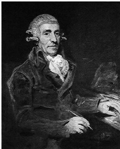
Йозеф Гайдн, портрет работы Дж. Хоппнера

Принц Уэльский пожелал иметь мой портрет 14 . В течение двух дней мы играли музыку каждый вечер по 4 часа — с 10 до 2 часов пополуночи, затем мы ужинали и отправлялись в постель в 3 часа.