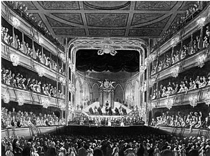
Первый театр Ковент Гарден

исполнял трель на высоком c и доходил до [верхнего] g . Второй тенор 23 пытается подражать ему, но не может вернуться от фальцета к естественному голосу, и кроме того, он совершенно немзыкален. Он поет в своем собственном темпе, то на 3/4, то на 2/4, делает цезуры, где ему вздумается. Но оркестр 24 к этому совершенно привык. Дирижер — господин Баумгартнер ( baumgartner; sic ) 25 , немец, который, однако, почти забыл свой родной язык. Театр очень темен и грязен и почти столь же велик, как Придворный театр в Вене. Простонародье на галерке во всех без исключения театрах очень наглое; неистовствуя, они задают тон и криками заставляют повторять или не повторять [номер]. Партеру и ложам приходится очень долго аплодировать, чтобы повторили что-то хорошее; так случилось и в тот вечер с дуэтом из III акта, который очень красив; почти четверть часа прошла в противостоянии ( pro und contra ), пока наконец партер и ложи не одержали победу — и дуэт 26 был повторен. Оба исполнителя стояли на сцене довольно испуганно, то отступая назад, то снова выходя вперед. Оркестр сонный.