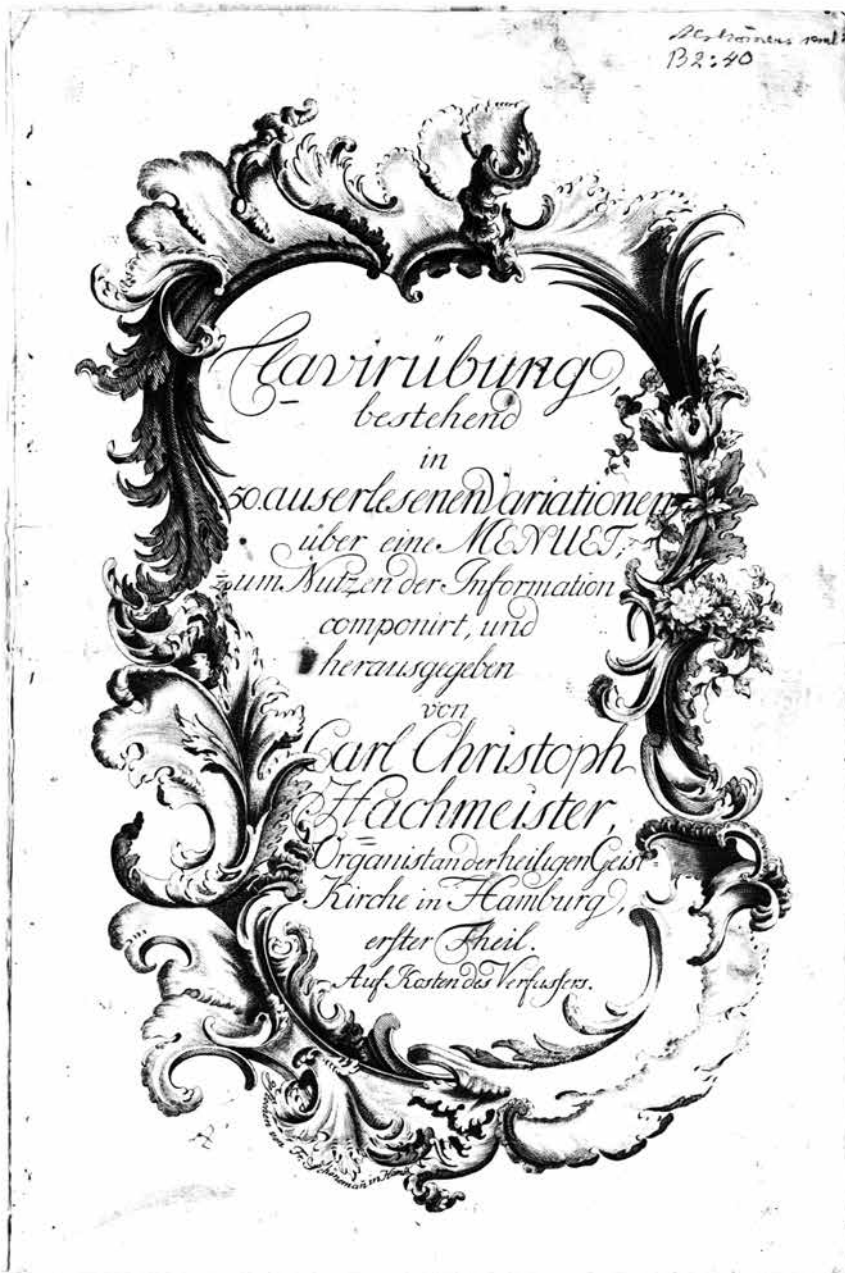
Ил. 4. Карл Кристоф Хахмайстер. Клавирное упражнение, состоящее из 50 изящных вариаций на менуэт... первая часть (титольный лист)