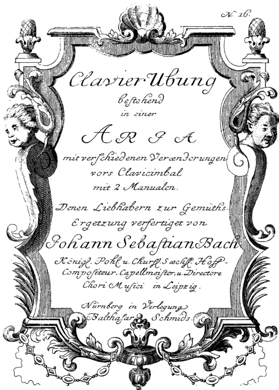
Ил. 3. Иоганн Себастьян Бах. Клавирное упражнение, состоящее из арии с различными вариациями... (титульный лист)