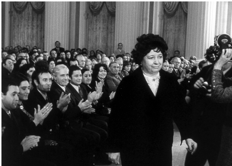
Ил. 1. Вера Дулова на церемонии вручения Государственной премии СССР. 16 января 1974 года, Свердловский (Екатерининский) зал Кремля. Фрагмент из документальной хроники «Вручение Государственных премий СССР». Центральная студия документальных фильмов (1974)