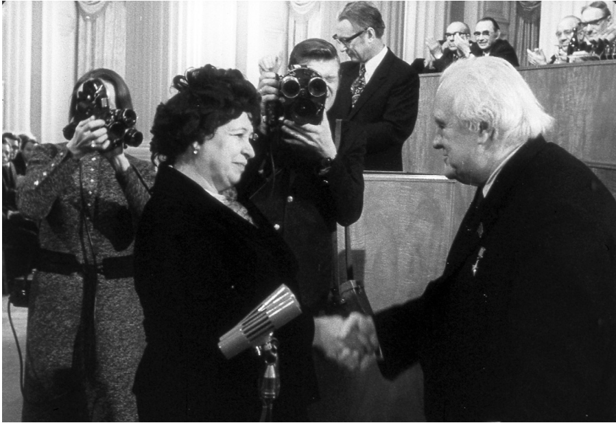
Ил. 4. Вера Дулова в момент награждения с председателем Комитета Николаем Тихоновым. 16 января 1974 года, Свердловский (Екатерининский) зал Кремля. Фрагмент из документальной хроники «Вручение Государственных премий СССР». Центральная студия документальных фильмов (1974)